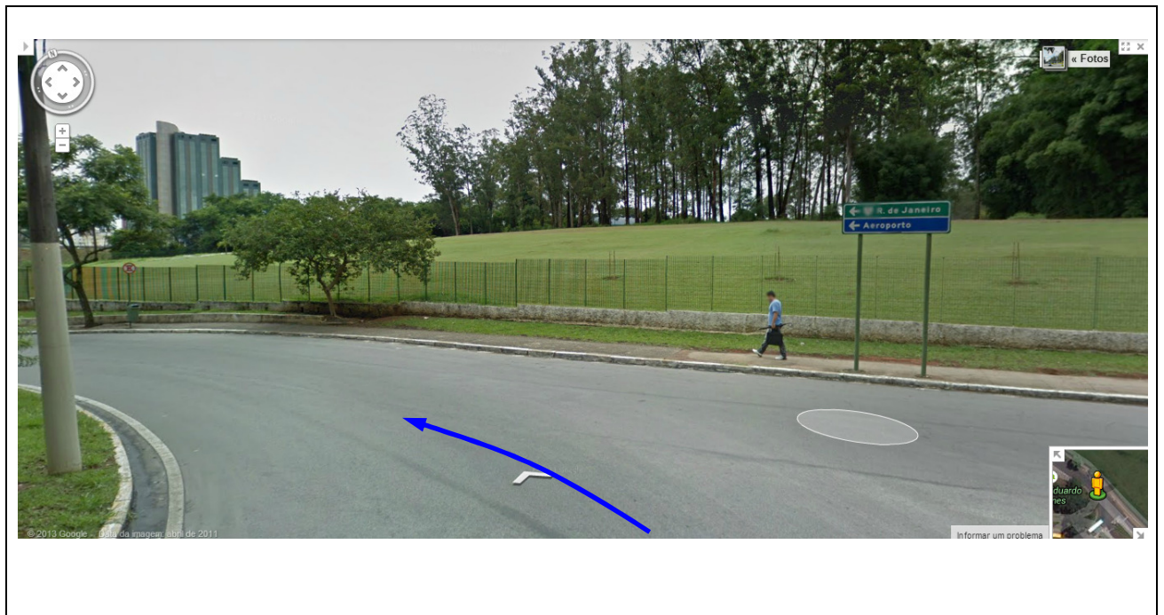
Fig. 04 - Retorno na direção do Aeroporto de São José dos Campos (sentido Rio de Janeiro)

A equipe deve fazer o contorno conforme mostrado pelas setas azuis.