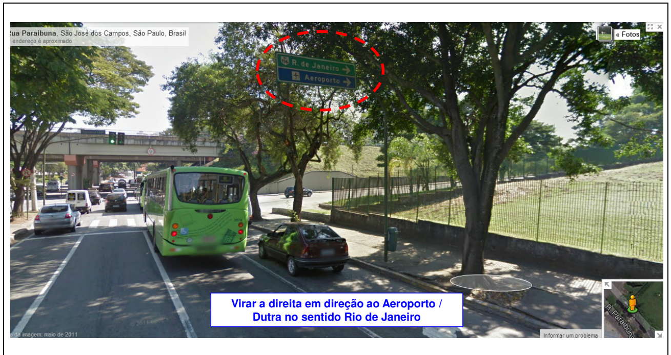
Fig. 05 - Indicação da direção do Aeroporto de São José dos Campos (sentido Rio de Janeiro)