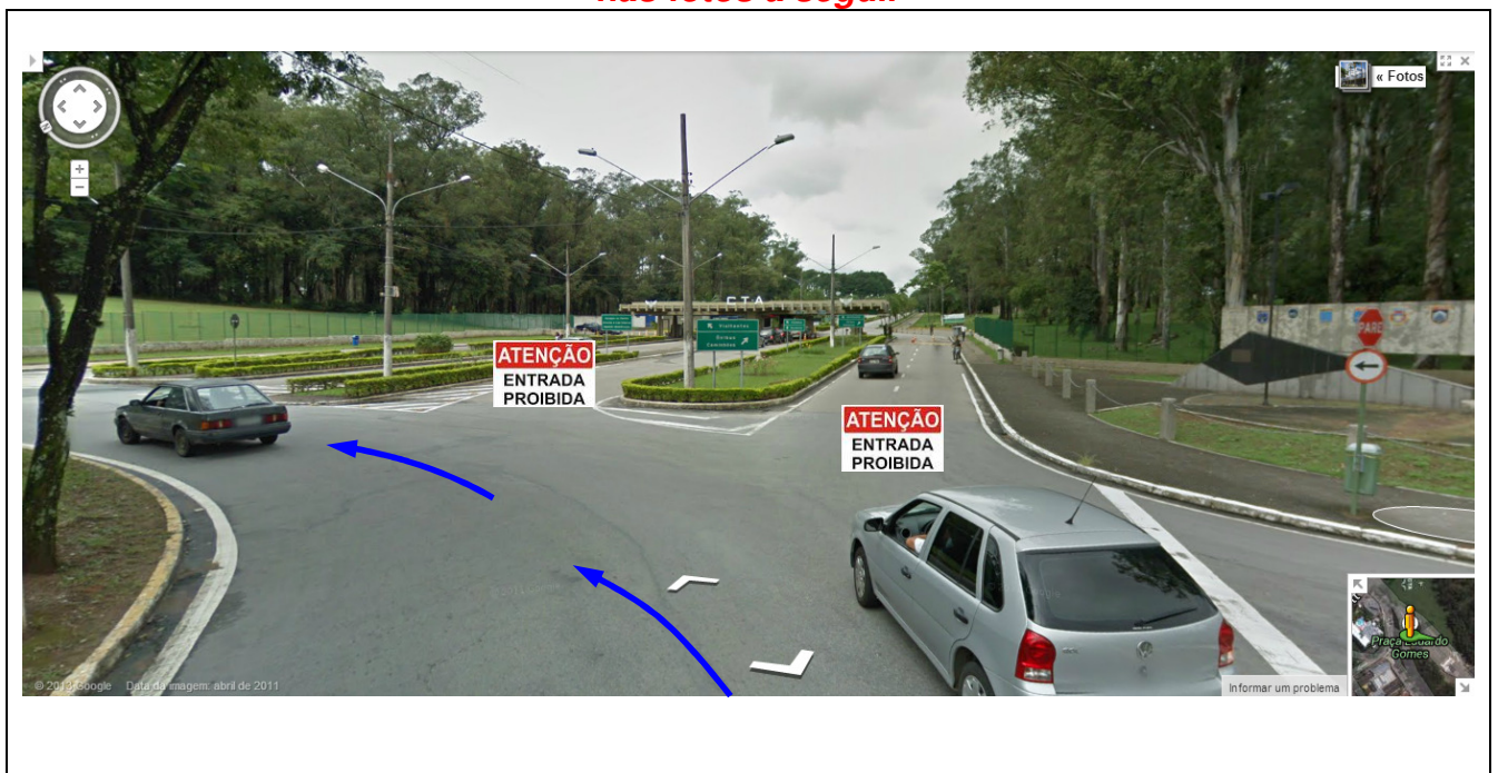
Fig. 02 - Imagem do portão principal do DCTA – cujo ingresso para a Competição AeroDesign é proibida.

A equipe NÃO DEVE tentar avançar na direção do portão principal, como mostrado nas fotos a seguir