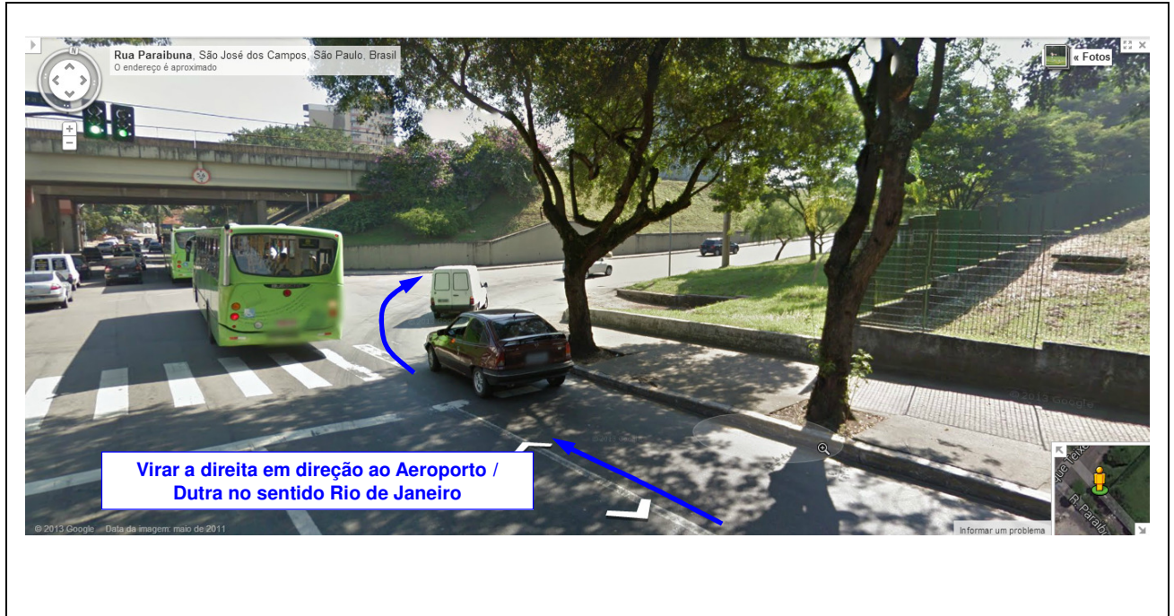
Fig. 06 - Indicação da direção do Aeroporto de São José dos Campos (sentido Rio de Janeiro).

As equipes devem seguir a Marginal da Via Dutra até o trevo mostrado na Fig. 02 da Mensagem 12. Manter-se à direita em direção ao Aeroporto / Embraer.